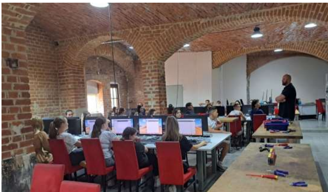
Обука - Дигитално пословање

Ученици су имали увод у оно што ће радити током наредних дана. Прве недеље упознавали су се са формирањем и анализом рада стартап предузећа, креирањем једноставних и комплексних датотека и VADO принципима пословања: визуелизација, анализа, дефиниција и оптимизација.