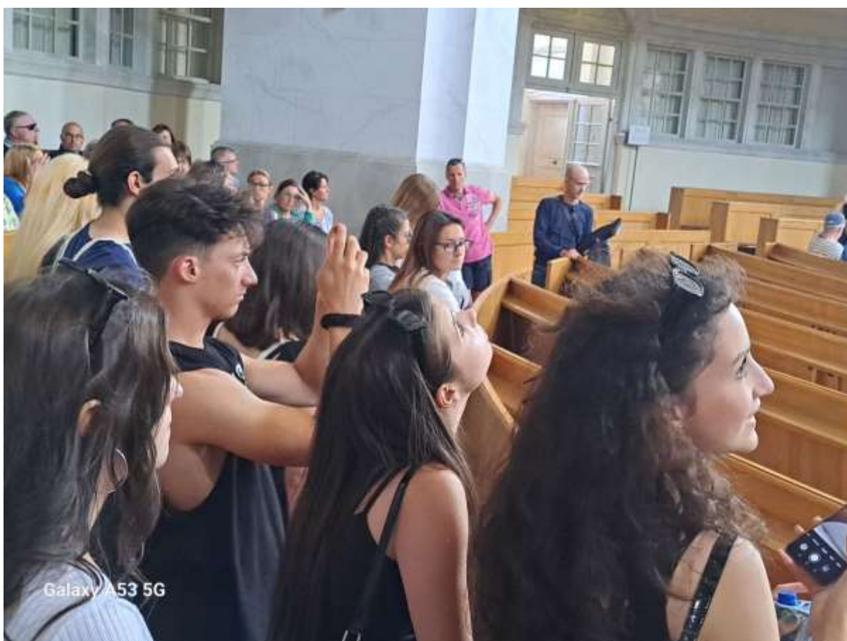
Стари град – Алтстадт